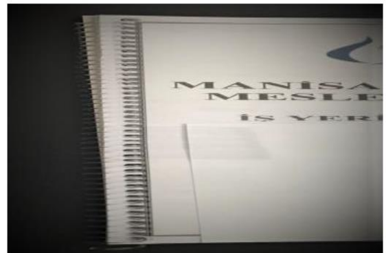
Yan Cilt Şekli