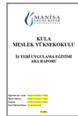
4-Ara Rapor Metni

Vize döneminde mail olarak gönderdiğiniz dosya eklenecek. (1.-9. hafta arası)