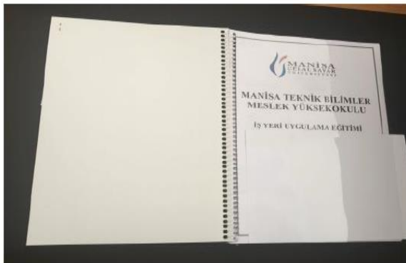
Ön Kapak Şeffaf Arka Kapak Beyaz